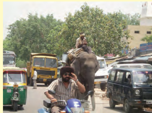
Je rijbewijs halen in Indië, waarschijnlijk niet evident! Je hebt er wel de keuzen tussen een gemotoriseerd voertuig of een ongemotoriseerde olifant!