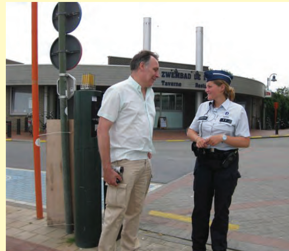
Socializing met de arm der wet???? Op heterdaad betrapt!