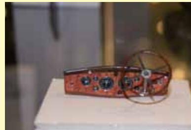
Een instrumentenbord, een waar juweeltje