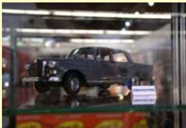
Het Franse Norev kan ook prachtige Duitse automodellen op een 18 e schaal bouwen.