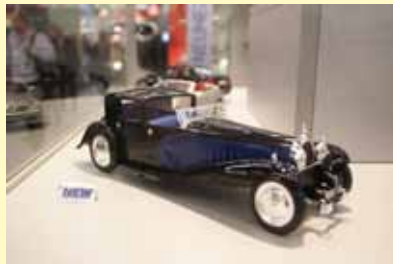
Het Franse Norev kan ook prachtige Duitse automodellen op een 18 e schaal bouwen.